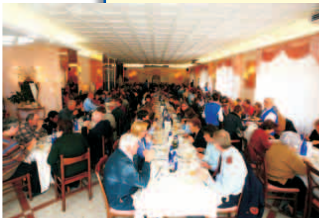
Tutti a tavola