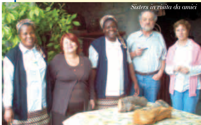
Sisters in visita da amici