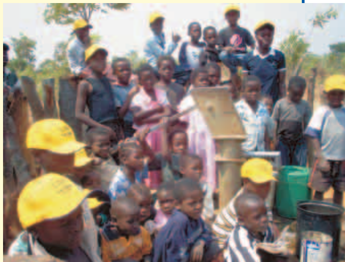
Il pozzo dell'acqua è terminato

Il servizio di Clinica Mobile è coperto da: 1 persona stipendiata da ZHS, 4 infermiere di cui 2 a tempo parziale che ricevono lo stipendio dal governo e una indennità di viaggio e pasto da ZHS oltre all'autista pagato da ZHS.