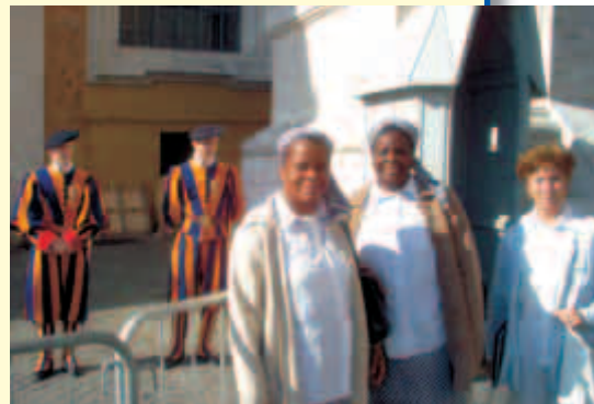
Sisters davanti al Vaticano

Un'immane visita a Venezia ha concluso la loro visita in Italia.