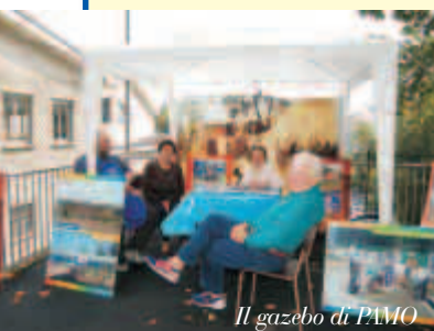
Il gazebo di PAMO