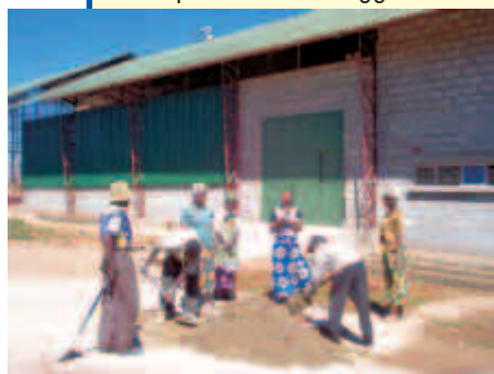
Aule in costruzione

Le due aule ultimate sono già funzionanti con porte, banchi e tavoli prodotti dalla nostra falegnameria. Con il completamento delle altre due in corso di costruzione avremo in totale 8 aule.