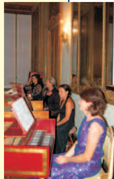
Le 4 musiciste

Anche in questa occasione, come in tutti gli altri incontri si sono potute presentare le finalit  della nostra associazione coinvolgendo cos  altre persone nei nostri progetti.