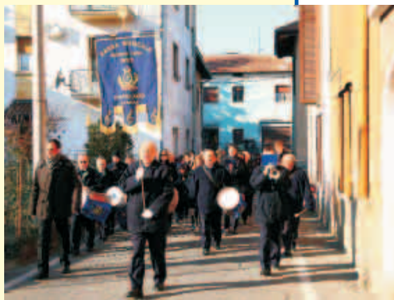
La sfilata apre la festa

È ormai un'amicizia consolidata quella tra la Banda "Giuseppe Verdi" di Capolago, Varese e PAMO anche quest'anno ci hanno voluti tra loro in occasione della festa di Santa Cecilia patrona della musica.