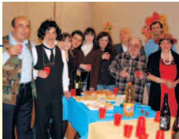
Il rinfresco dopo lo spettacolo