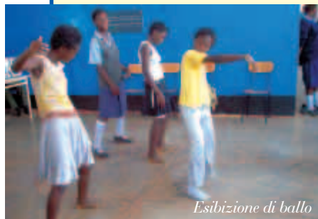
Esibizione di ballo

Anche a Lukamantano Village è stata celebrata la Festa dell'indipendenza con sfilata, alza bandiera e canto dell'inno nazionale, canti, balli e una colazione un po' più ricca del solito.