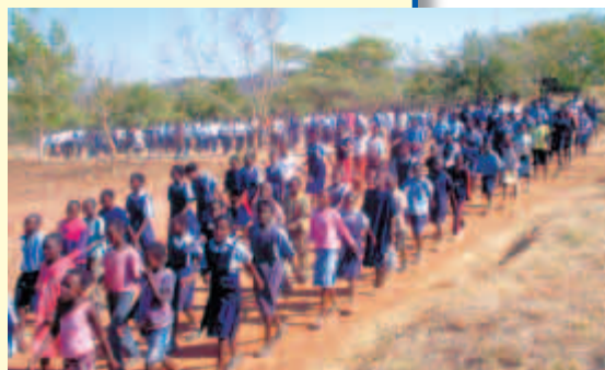
Sfilata per la Festa dell'Indipendenza