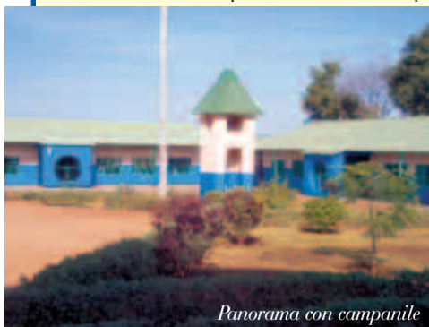
Panorama con campanile