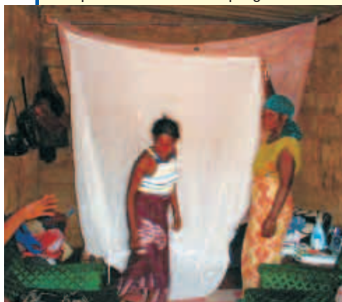
Montaggio della zanzariera