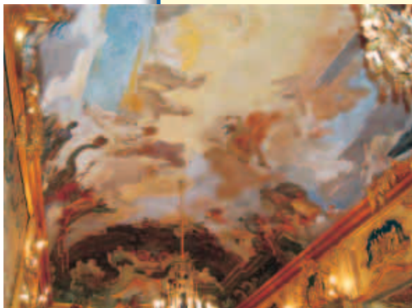
L'affresco del Tiepolo

Nella splendida cornice di Palazzo Clerici a Milano, l'Associazione "Omaggio al Clavicembalo" e PAMO hanno dato vita ad un evento speciale per raccogliere fondi a favore dello Zambia.