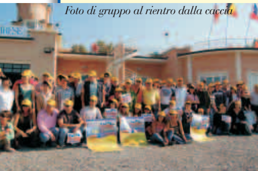
Foto di gruppo al rientro dalla caccia

La splendida giornata di sole e il grande entusiasmo dei partecipanti hanno dato un grosso contributo all'ottima riuscita dell'evento.